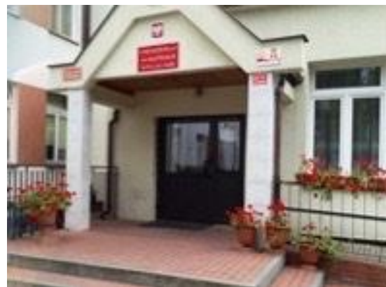
Szkoła Podstawowa nr 1 im. Jana Pawła II w Sochaczewie tel. 46 862 24 49, mail: sekretariat@sp1soch.pl www.sp1soch.pl