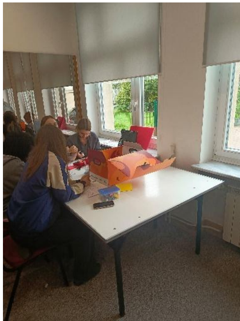
Ogniwo solarne i multimetr.