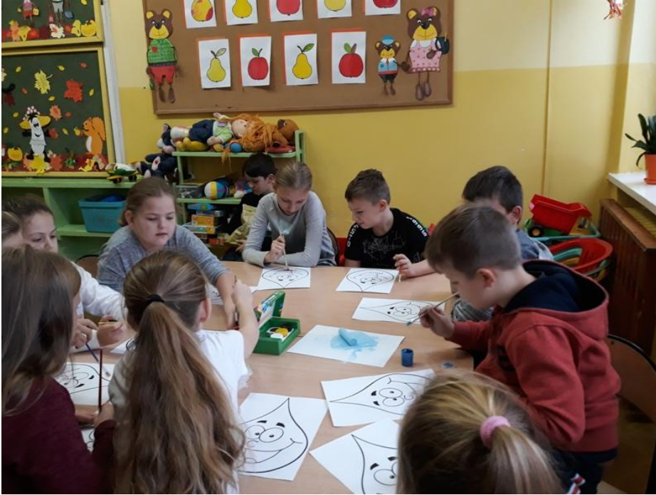
Image 1 of 8 | You are viewing the image with filename 20181119_081447.jpg